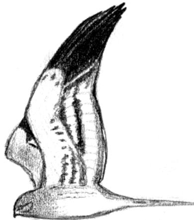
Grauwe Kiek